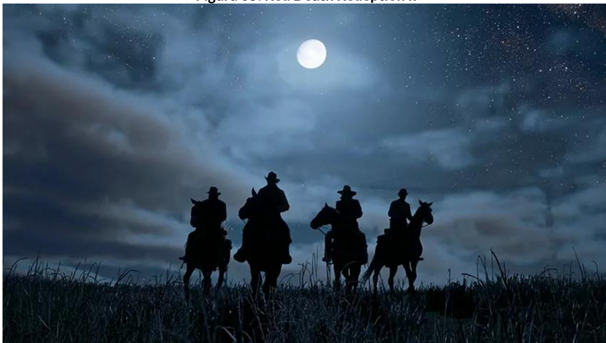
Figura 05: Red Death Redeption II