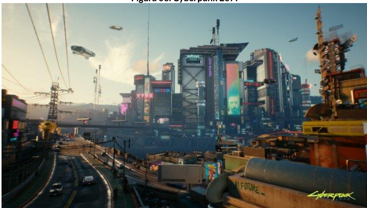
Figura 06: Cyberpunk 2077