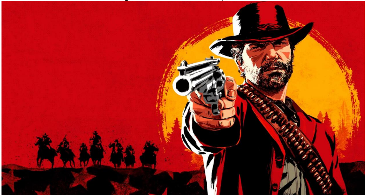
Figura 01: Red Death Redeption II

Fonte: https://store.rockstargames.com/pt-BR/game/buy-red-dead-redemption-2 .