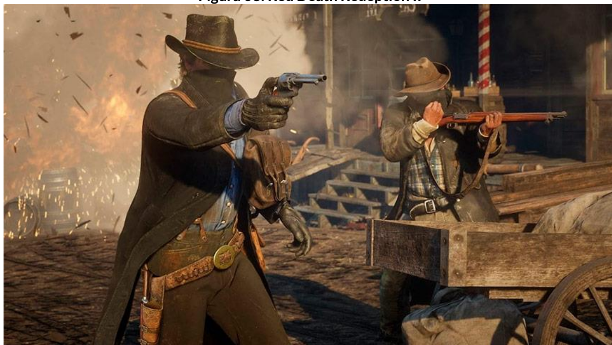
Figura 03: Red Death Redeption II