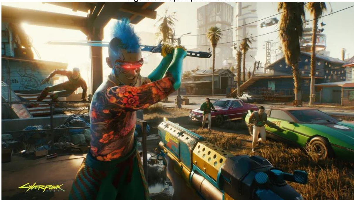
Figura 04: Cyberpunk 2077